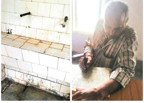
हरिभूमि न्यूज | ब्यावरा

महाविद्यालय का अधिकतर स्टाफ नदारद, उपस्थितों ने अनुपस्थित स्टाफ की कमियों को छुपाने का किया प्रयास