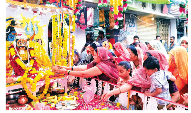
हरिभूमि न्यूज | नलखेड़ा

सावन माह के अंतिम सोमवार को नगर के प्राचीन श्री गुप्तेश्वर महादेव मंदिर से भगवान भोलानाथ की दूसरी सवारी बड़े ही धूमधाम से नगर में निकली गई। सवारी में फूलों से सुसज्जित पालकी में भगवान भोलानाथ को विराजित कर नगर भ्रमण हेतु निकाला गया। सवारी में भजन मंडलियां शिव भजनों पर आधारित भजनों की प्रस्तुतियां दे रही थी। 18 अगस्त को नगर में गुप्तेश्वर महादेव की शाही सवारी निकाली जाएगी। गुप्तेश्वर मंदिर से सार्थ 4 बजे भगवान भोलानाथ की आरती उपरांत सवारी प्रारंभ हुई। जो किराता रोड सावलिगा नाथ मंदिर अशोक मार्ग चौक बाजार गणेश बगलामुखी मंदिर मार्ग से होते हुवे मां बालामुखी मंदिर पहुंची। यहाँ