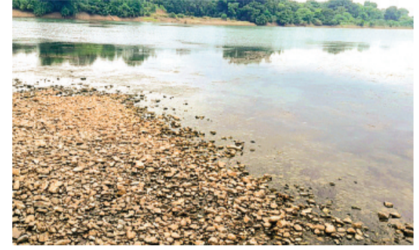
हरिभूमि न्यूज | राजगढ़

इसे प्रकृति का खेल कहें या कुछ और कि करीब एक हफ्ते पहले राजगढ़ से प्रवाहित जिस नेवज नदी का पानी छोटी पुलिया के 4-5 फीट ऊपर तक बह रहा था, उसी नेवज नदी का तला या सरल शब्दों में कहें तो पटपड़े तक सोमवार को नजर आने लगे। बीती 28 जुलाई को तो हालात यह थे कि नेवज नदी के लगातार बढ़ते जलस्तर को देखते हुए निचली बस्तियों के रहवासियों को एलर्ट रहने की मुनादी तक करवा दी गई थी। इसके साथ ही स्वयं कलेक्टर व अधीनस्थ अधिकारियों ने मौके पर पहुंचकर स्थिति का जायजा लिया था। इसके साथ ही आमजन की सुरक्षा हेतु पुलिया के दोनों ओर बेरोकटिंग करते हुए पुलिसकर्मियों की ड्यूटी लगाई गई थी।