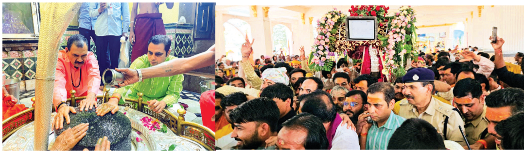
नलखेड़ा

नगराधिपति बाबा बैजनाथ की शाही सवारी सावन माह के आखिरी सोमवार को धूमधाम से निकाली गई। बाबा बैजनाथ ने अपने पूरे लाव लश्कर के साथ शाही ठाट - बाट से चांदी की पालकी में विराजित होकर नगर भ्रमण किया और अपनी प्रजा के हाल जाने। बाबा बैजनाथ के स्वागत में पूरे नगर को सजाया गया था, जगह-जगह भक्तों ने अपने घरों की छतों एवं सड़क के दोनों ओर खड़े होकर बाबा बैजनाथ की पालकी पर पुष्प वर्षा की तथा बाबा बैजनाथ का जयघोष किया। हर कोई बाबा बैजनाथ के दर्शन को आतुर दिखाई दिया, पूरा आगर नगर बाबा बैजनाथ की भक्ति के रंग में रंगा हुआ नजर आया। शाही सवारी में लगभग